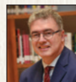
Καθηγητής Αριστείδης Σάμιτας Οικονομικών και Ανάπτυξης